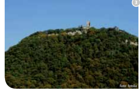
Siebengebirge bei Königswinter und Drachenfels