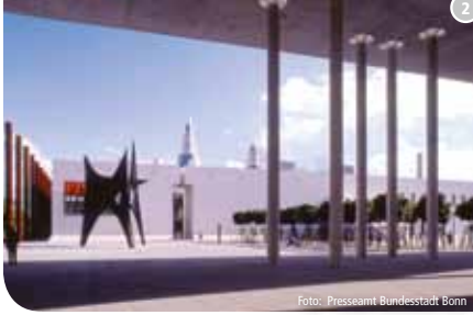
Kunst- und Ausstellungshalle der Bundesrepublik Deutschland